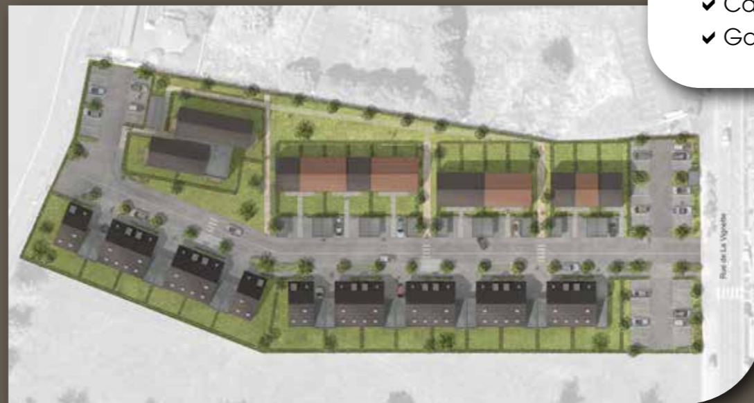
Plan de masse

Conçues par le Cabinet TAO Architecture, les maisons proposées, de 3 ou 4 chambres, conjuguent une architecture actuelle mariant avec élégance des matériaux modernes et traditionnels pour favoriser esthétique, confort, intimité et lumière naturelle.