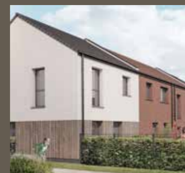
Maison T4 avec carport

Choisissez entre nos 2 modèles de maison T4 ou T5 :