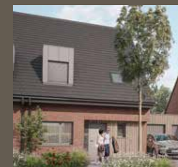
Maison T5 avec garage